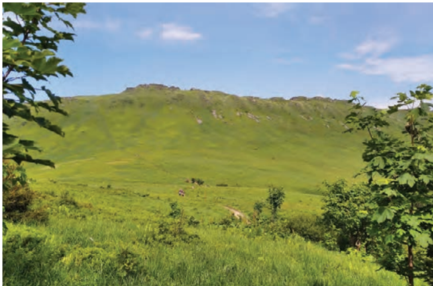
Widok na skrzyżowanie szlaków na Przełęczy Goprowskiej