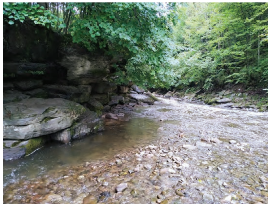
Sine Wiry (powyżej) i Zwieżło (poniżej)