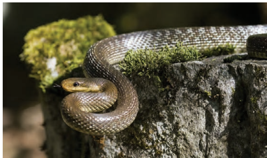
Największy bieszczadzki wąż